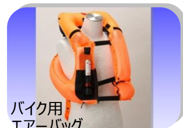
バイク用 エアバッグ

【構成】 エステル・エーテル 【対応サイズ】 折径：100mm ~ 200mm 厚み：60μm ~ 200μm