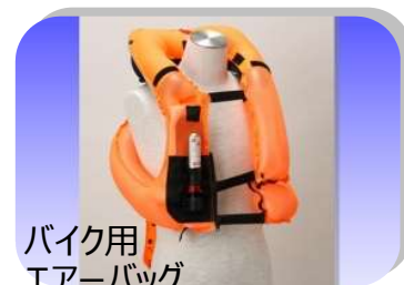
バイク用 エアバッグ